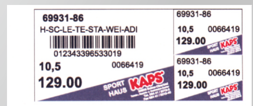
90 x 40 mm Sandwich mit 3 Abziehteilen