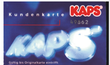
Individuell gestaltete Kundenkarte