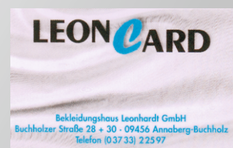
Individuell gestaltete Kundenkarte

Ob Sie lieber ausführlich oder gezielt informiert werden wollen, überlassen wir Ihnen. Wir gewährleisten lediglich, dass Sie beides können.